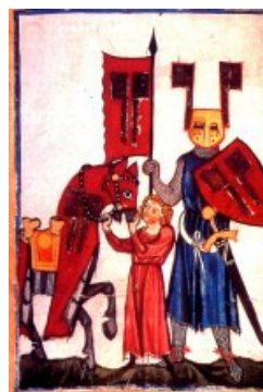
Parzifal ur "Manesse"; Heidelberg univ.bibl.

Business is war , förklarade man när jag kom från landstinget och blev företagsledare på IBM. Alla hjältesagor handlar om lusten i att tävla, om utmaningar och om tillfälliga motgångar som sporrar till framgång. I näringslivet talar man om att "erövra marknadsandelar", om "priskrig", "strategier", "insatser" och om "team bildning". Det är ett symbolspråk som anknyter till stridens och jaktens spänning. Konkurrens, laganda och tydligt ledarskap kan vara lika viktiga i ekonomiska verksamheter som det var när Homeros skrev om grekernas kamp mot Troja. Nu som då behöver vinnarlaget både Rambohjälten Akilles och strategen Odysseus som är förtänksam.