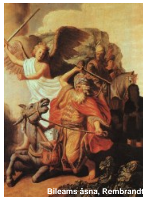
Bileams åsna, Rembrandt

följa hans eller hennes förvirring och kamp i sökandet efter en lösning. Där finns alltid destruktiva krafter en häxa, en trollkarl, eller ett monster som skall övervinnas. Berättelserna ger modeller för hur man kan bryta dödlägen och komma vidare. Det är lika viktigt på arbetet som privat. Det harmoniska livet, när hjälten och prinsessan redan har fått varandra, behöver ingen träna på. Vi vill höra om problemlösningar och känna igen oss i huvudpersonens mod och misstag, uthållighet och risktagande, försiktighet, medkänsla och påhittighet. I alla förnyelseprocesser lurar faror och där finns hjälpande krafter. Det gäller att känna igen dem. Starka berättelser ger ett lyft som om man kunde se sig i ett fågelperspektiv och ana ett större sammanhang. Då klarar man mer. Man är inte längre lika förvirrad. Livet har blivit mer intressant, om än inte enklare.