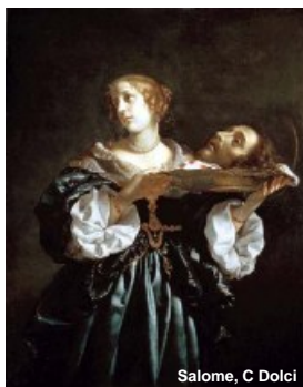
Salome, C Dolci

stadier. Men berättelser om Utopia kan få människor på fötter. Nya företag behöver sina visionärer. Emigranter bärs av tron på ett nytt och annorlunda samhälle. Men när man väl är framme, då gäller fortfarande människans villkor. En etablerad organisation i arbetslivet eller ett samhälle där barn skall växa upp och människor skall åldras behöver andra ledare än de som talar sagospråk. Då gäller det att ha verklighetskontakt vilket betyder beprövade erfarenheter, fakta, vetenskap. Men sagan finns kvar som en underström. Den berättar om själen. Om det som alltid är föränderligt inom oss själva.