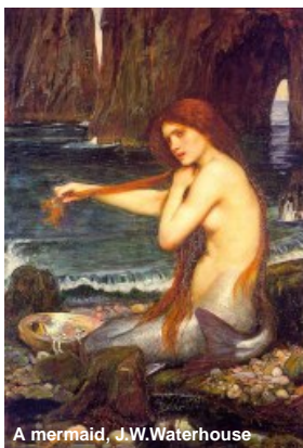
A mermaid, J.W. Waterhouse

Nervbanor från vänsterhjärnan korsar över till högerhanden. Den sidans sätt att tänka och känna passar för skrivande, strategiska planer, lagarbete och bruksanvisningar. Då skall språket vara exakt och entydigt. Logiskt. Vetenskap och teknologi, som är grunden för modernitet och framsteg bygger på detta. Vänster del av kroppen är känsligare för beröring. Man kan reagera lika starkt när man blir